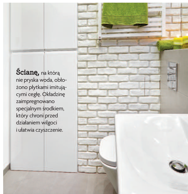
Ściane , na którą nie przyska woda, obłożono płytkami imitującymi cegłę. Okładzinę zaimpregnowano specjalnym środkiem, który chroni przed działaniem wilgoci i ułatwia czyszczenie.

Szafa z lakierowanej płyty MDF, zrobiona na wymiar, zajęła wnękę z kaloryferem. Nowy grzejnik zamontowano na ścianie obok. Wybrano praktyczny model drabinkowy, który jest zarazem suszarką na ręczniki.