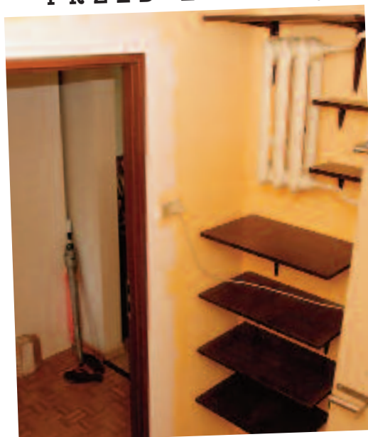
We wnęce przy drzwiach znajdował się stary żeliwny kaloryfer. Zawieszono tu półki wprowadzając do wnętrza wrażenie chaosu.